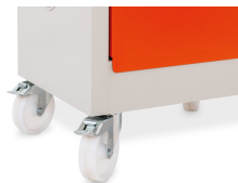
11657 - Rollensatz für Akku-Lagerschrank FMplus