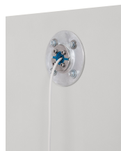
11660 - Kabeldurchführung für Akku-Lagerschrank FMplus