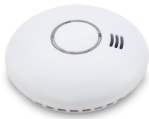
11658 - Rauchmelder (1 x RWM-460 vernetzbar)