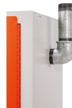
11661 - Adapter für Entlüftungsanschluss für Akku-Lagerschrank FMplus