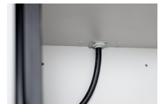
11884 - Kabeldurchführung 6/20 u. 12/20 Sicherheitsschrank PROline