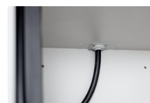
11884 - Kabeldurchführung 6/20 u. 12/20 Sicherheitsschrank PROline