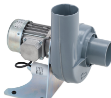
11431 - Modell 1 Radial 230 V, ohne Ex-Motor *** mit Schlauch 750 mm ***