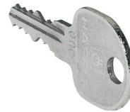
12077 - Ersatzschlüssel PROline für PROline mit Schießkern 0001