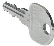
12077 - Ersatzschlüssel PROline für PROline mit Schießkern 0001