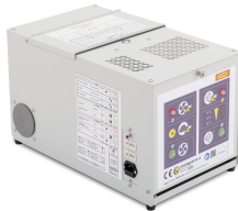
10963 - Umluftventilator SST UL mit Adapter SST-P F90 für Sicherheitsschrank