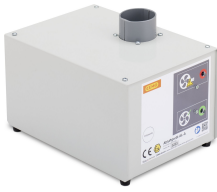
8739 - Abluftventilator SST AL mit Adapter SST-P F90 für Sicherheitsschrank