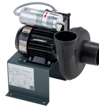
11432 - Modell 2 Radial 230 V, mit Ex-Motor *** mit Schlauch 750 mm ***