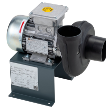
11433 - Modell 3 Radial 380 V, mit Ex-Motor *** mit Schlauch 750 mm ***