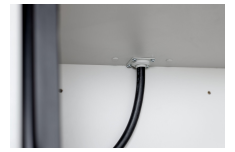
11884 - Kabeldurchführung 6/20 u. 12/20 Sicherheitsschrank PROline