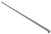
12074 - Zubehörpaket aktive Lagerung Sicherheitsschrank PROline 6/20 u. 12/20