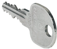
12077 - Ersatzschlüssel PROline für PROline mit Schießkern 0001