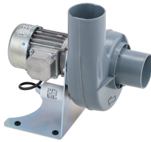
11431 - Modell 1 Radial 230 V, ohne Ex-Motor *** mit Schlauch 750 mm ***