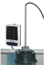
10703 - Seguro rebosamiento cpl. p. tanque aceite usado CUBE 1000-2500 L